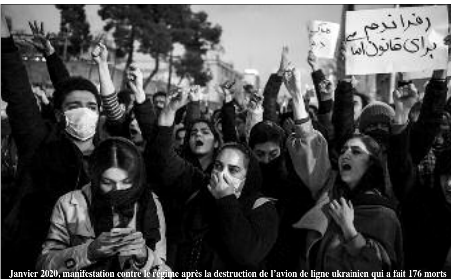
Janvier 2020, manifestation contre le régime après la destruction de l'avion de ligne ukrainien qui a fait 176 morts

Selon le ministère iranien de la Santé, le nombre de suicides a augmenté d'environ 100 000 cas entre 2018 et 2019. Le taux de suicide en Iran est plus élevé dans les provinces de l'Ouest, là où les taux de chômage sont également les plus importants. Selon la chargée du programme de prévention du suicide au ministère de la Santé, les principales causes du taux élevé de suicide sont « un environnement instable, la pauvreté et le chômage ». La jeunesse, les femmes et les couches les plus pauvres sont les principales victimes de l'absence de perspective. Ainsi, 75 % des tentatives de suicide sont le fait des 15 à 34 ans. Les statistiques extraites des données du ministère de la Santé iranien montrent que l'Iran possède le taux de suicide de femmes et de filles le plus élevé du