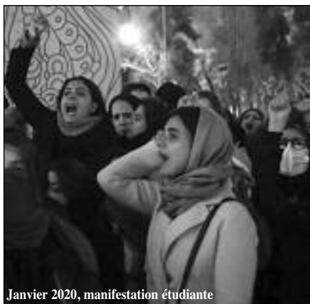
Janvier 2020, manifestation étudiante

Le peuple irakien a connu quant à lui 8 ans de guerre meurtrière contre la République islamique, une intervention destructrice des États-Unis suite à l'invasion du Koweït par le dictateur Saddam Hussein en 1991, un embargo criminel imposé par les puissances impérialistes, une nouvelle guerre en 2003 menée par l'impérialisme étatsunien, la violence d'Al Qaïda et de l'État islamique, la guerre contre Daesh conduite par les États-Unis et la République islamique... Le pays est aujourd'hui exsangue et mis en coupe réglée par les États-Unis et la République islamique d'Iran. D'ailleurs la