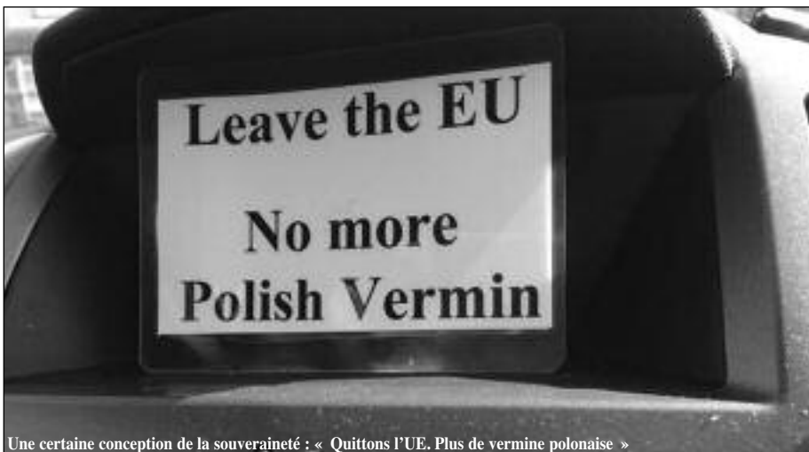
Une certaine conception de la souveraineté : « Quittons l'UE. Plus de vermine polonaise »

Les arguments simplistes selon lesquels « la classe ouvrière a abandonné le Labour