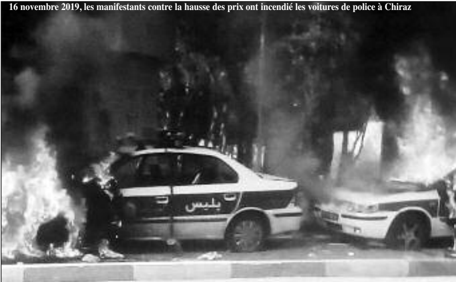
16 novembre 2019, les manifestants contre la hausse des prix ont incendié les voitures de police à Chiraz

lation autour de ses dirigeants et autour de la République islamique. Les appels à l'unité nationale se sont succédé. L'organisation des funérailles de Soleimani, dont le corps a traversé le pays et principalement les villes qui avaient été les épicentres de la révolte populaire du mois de novembre dernier, témoigne de cette tentative. Le Guide de la Révolution, Ali Khameneï a même mené personnellement le prêche de la prière du vendredi qui avait suivi la mort de Soleimani. Cela n'était pas arrivé depuis 8 ans.